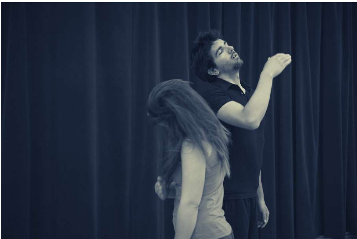
Les auteurs en mouvement (2014)

Tous deux partisans d'associer nos démarches artistiques à une démarche sociale, il nous semble approprié d'utiliser le médium du théâtre, de la fiction, pour amener un public d'adolescent.e.s à se questionner, à ouvrir des pistes de réflexion et à éveiller leurs consciences sur leurs actes et l'impact qu'ils peuvent avoir.